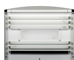
VISTA DE LAS LÁMPARAS